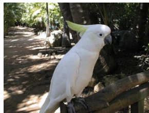
なかなか「ワイルド」なオウムです。(c) 2000, K.J.Kawai.

みなさんは、ワイルドカードと聞くと、何を思いうかべますか。米大リーグのプレーオフに、地区優勝していない(2位)のに出場してくるチームですか。カードゲームUNOにあるワイルドカードですか。「ツール・ド・フランス」などの自転車レースには「主催者推薦枠」というのがあり、これもワイルドカードとよばれます。