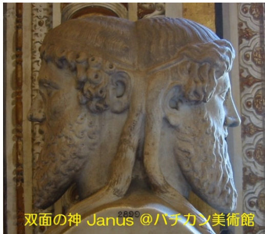
双面の神 Janus @パナコン美術館

睦月は、旧暦1月 (January) の呼称です。今年は、2月5日が旧正月 (1月1日) になります。コンピュータの世界では、月、そして、日付、時刻をあつかうのに、特有の方法を uses。