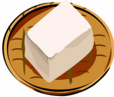
トウフは安全? ～食品の科学～

サイエンス・カフェの第1回目では、科学で「分かる」・「語る」・「判断できる」を合言葉に、身近な科学の話題をいろいろ取り上げたいと思います。